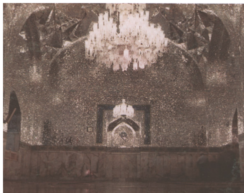
تصویر ۸. کتیبه‌های دور محراب رواق دارالسلام