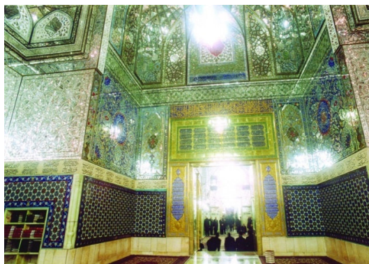
تصویر ۷. اشعار فارسی در بالای ازاره‌های اطراف رواق دارالسیاده

❖ و در اینجا به اختصار به آنها اشاره می‌شود. بالای قسمتی از ازاره شرقی دارالسیاده که به دارالحفاظ می‌رود قصیده‌ای از اشعار سرخوش به سال ۱۲۷۱ق/۱۸۵۴ م به خط نستعلیق کتیبه شده است (تصویر ۷).