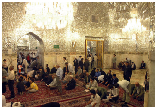
تصویر ۹. کتیبه‌های اشعار فارسی، بالای ازاره دور رواق دارالسلام

علاوه بر کتیبه قرآنی و دعایی رواق دارالسلام، در بالای ازاره در اطراف رواق، قصیده بسیار طولانی در ستایش امام رضا (ع) با خط نستعلیق روی سنگ حجاری شده است (تصویر ۹).