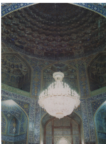
تصویر ۵. تزیینات کتیبه‌ای اطراف رواق گنبد الله وردی خان

❖ سال اول، شماره سوم، شماره مسلسل ۳، پاییز ۱۳۹۳ از بالای سمت راست تا سقف و از آنجا به سمت پایین تا بالای ازاره سمت چپ، بر کتیبه کاشی معرق به خط ثلث آیه‌های اول تا پنجم سوره مبارکه ملک از «تَبَارَكَ الَّذِي تَعَذَّبِ السَّعِيرِ» با مضمون توانایی خداوند، آمرزنده گناهان، بخشنده نظم در خلقت خداوند است نگاشته شده است. تاریخ اتمام کاشی کاری آن در پایه شمالی سردر با کاشی ممتاز و معرق سال ۱۰۲۲ ش/۱۶۱۳ م نوشته شده است (کاویانان، ۱۳۵۴: ۱۵۲) (تصویر ۵).