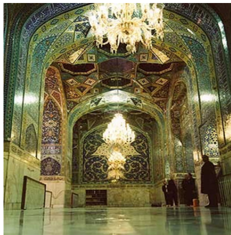
تصویر ۲. رواق دارالفیض، به سمت در ورودی به حرم مطهر

در حاشیه در ورودی به حرم مطهر، آیه هفتم سوره واقعه با مضمون نیکو حال بودن اصحاب یمین، در بالای طاق در کوچک به طرف حرم، آیه ۱۹۷ سوره بقره با مضمون برتری تقوا و خداترس بودن و در دیوار جنوبی این رواق، آیه ۲۸۵ سوره بقره با مضمون ایمان داشتن به خدا و پیامبر، در بدنه دیوار وسط طرف راست، آیه ۴۵ سوره حجر با مضمون پاداش اهل تقوی و در طرف چپ، آیه ۳۳ سوره ق با مضمون خاشع بودن در مقابل خداوند، مزین شده است (تصویر ۲).