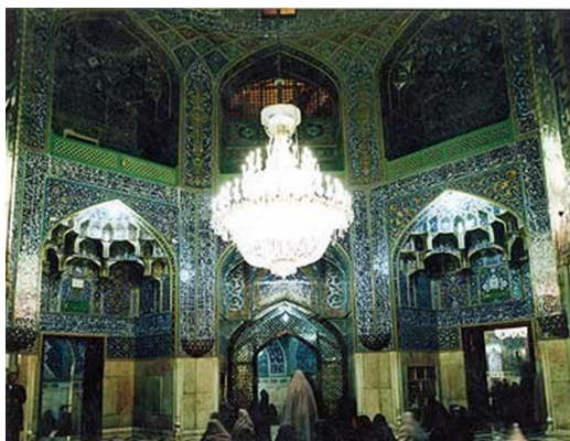
تصویر ۶. کتیبه‌های صفه‌های اطراف رواق الله وردی خان

«عَنِ الْإِمَامِ جَعْفَرِ الصَّادِقِ عَلَيْهِ السَّلَامُ قَالَ: يَقْتُلُ حَفْدَتِي بِأَرْضِ خُرَاسَانَ قَالَ فِي مَدِينَةِ بَقَالٍ لَهَا طُوسٌ، مَنْ زَارَهُ أَلَيْهَا عَارِفًا بِحَقِّهِ أَخَذَتْهُ بِيَدِي يَوْمَ الْقِيَامَةِ وَأَدْخَلَتْهُ الْجَنَّةَ وَانْكَانَ مِنْ أَهْلِ الْكِبَايِرِ» (عطاردی، ۱۳۷۱، ج ۱: ۱۹۶ - ۱۹۴). قَالَ سَمَلْتُ أَبَا جَعْفَرٍ مُحَمَّدَ الْجَوَادِ عَلَيْهِ السَّلَامُ مَا لِمَنْ زَارَ وَالدَّكْرَ عَلَيْهِ السَّلَامُ بِخُرَاسَانَ فَقَالَ الْجَنَّةُ وَاللَّهِ الْجَنَّةُ وَاللَّهِ. قَالَ: قُلْتُ جَعَلْتَ فِدَاكَ وَمَا عَرَفَانِ حَقِّهِ؟ قَالَ تَعَلَّمُ أَنَّهُ إِمَامٌ مَعْتَرِضِ الطَّاعَةِ غَرِيبٍ شَهِدَ مِنْ زَرَاهِ عَارِفًا بِحَقِّهِ. اعْطَاءَ اللَّهُ عَزَّ وَجَلَّ اجْرَ سَبْعِينَ شَهِيدًا، مِمَّنْ ابْتِشَاهُ بَيْنَ يَدَيِ رَسُولِ اللَّهِ عَلَيْهِ وَآلِهِ (تصویر ۶).