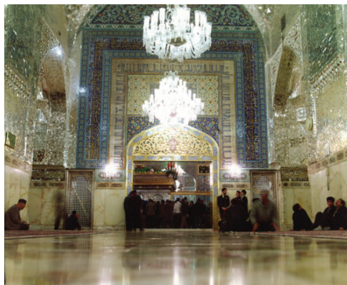
تصویر ۱. رواق دارالحفاظ ورودی به حرم مطهر

روند حکاکی کتیبه‌های قرآنی از دوره‌ای به دوره دیگر تفاوت دارد. رواق دارالحفاظ با مساحت ۲۱۷ مترمربع، بزرگ‌ترین رواق در بین رواق‌های صفویه و تیموری است. رواق دارالحفاظ دارای کتیبه‌های قرآنی حدیثی، دعایی، اسماء‌الحسنی و اشعار فارسی می‌باشد. برای ورود به حرم مطهر از دلانی عبور می‌شود که در آنجا آیه اذن دخول یا سوره احزاب آیه ۵۳ نگاشته شده و مضمون آن اجازه ورود است. کتیبه‌های بعدی شامل آیه ۲۳ سوره شوری به معنا بدون اجر بودن رسالت پیامبران، ظلم و ستم نکردن (شعراء / ۲۲۷)، اطاعت کردن از اولی امر (نساء / ۵۹)، طعام دادن یتیمان (انسان / ۷)، اهمیت جهاد در راه خداوند (نساء / ۹۵)، اهمیت تضرع به درگاه باری تعالی (آل عمران / ۸)، اشاره به رزاقی خداوند و توکل کردن بر او (طلاق / ۳)، برتری خداوند و تسلیم بودن در مقابل او (نمل / ۳۱ - ۲۹) و پیروزمند بودن خداوند (مائده / ۵۶) را یادآوری می‌نماید و در ادامه، به اهمیت نماز و زکات (مائده / ۵۵) اشاره می‌کند. متذکر شدن عدم شرک و برتری خداوند (قصص / ۸۸)، اهمیت توکل بر خداوند (تغابن / ۱۳)، پاداش دادن متقیان (شعراء / ۹۰) و باز هم به پاداش دادن متقیان در بهشت (زمر / ۷۳) اشاره دارد. همچنین خداترس بودن را از ویژگی‌های مؤمن برمی‌شمارد. بالاخره در (مؤمنون / ۱۱۸) بخشندگی خداوند و آفاضة خیر از پرتوی خداوندی اشاره می‌کند (نور / ۳۶) (تصویر ۱).