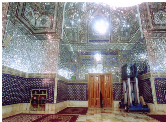
تصویر ۳. رواق دارالسیاده، جنب دارالحفاظ

❖ شکر کردن است و در قسمت دیگر، آیه ۲۸ سوره رعد با مضمون ایمان‌آوردندگان با ذکر خداوند آرامش می‌گیرند و یاد خدا آرامش‌بخش است. در دایره، سوره مبارکه قدر با مضمون توصیف عظمت شأن نزول قرآن در شب قدر است (تصویر ۳).