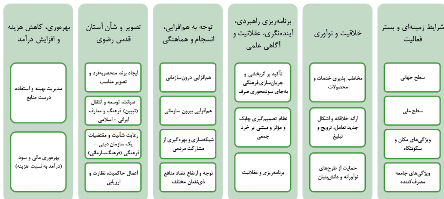
شکل ۲. شبکه مضامین مؤلفه‌های اقتصاد فرهنگ در آستان قدس رضوی

اقتصاد فرهنگ از جمله حوزه‌های سودآوری است که می‌توان با توجه به آن، در کنار درآمدزایی، اهداف فرهنگی و انتقال معانی را نیز دنبال کرد. در این زمینه، پژوهش ما با استفاده از روایات کتاب عیون الاخبار الرضا، فرمایش‌های مقام معظم رهبری، سیاست‌های کلان آستان قدس رضوی و با تکمیل نکات باقی‌مانده به وسیله نوشته‌های نظری موجود در حوزه اقتصاد فرهنگ، مؤلفه‌های اقتصاد فرهنگ در آستان قدس رضوی را در قالب شبکه مضامین استخراج کرده است؛ در شکل ۲ مضامین نهایی در قالب نمودار مشاهده می‌شود.