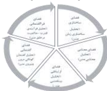
نمودار (۱) الگوی پدام و ۵ فضای مطرح شده در آن Diagram (1) Pedom pattern and 5 spaces mentioned in it

گیرد. پیشا ساختار خود متکی بر عوامل درونی و بیرونی است. از جمله عوامل درونی آن مبانی اعتقادی و جهان بینی امام (ع) است. عوامل بیرونی می تواند بر فضای قدرت، سیاست و عوامل دیگر استوار باشد. ناگفته نماند که عنصر تقیه نیز در برخی موارد نباید فراموش شود. چه بسا گفتمان امام بر اصل تقیه، به عنوان پیشا ساختار، استوار باشد. در واقع تقیه همان گونه که به عنوان عامل درونی محسوب می شود، از عوامل بیرونی حکایت دارد که نیازمند واکاوی است. از این رو، تحلیل فضایی که در آن «تقیه» صورت گرفته است، قراین فراوانی می طلبد (خاکپور و همکاران، ۱۳۹۷: ۸۸ و ۱۳۹۹: ۲۶۹). در ادامه نمودار پنج فضا ارائه می شود.