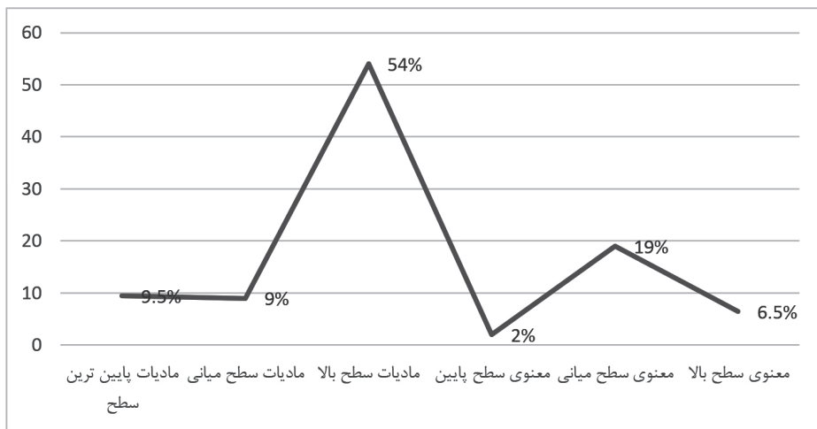
نمودار ۱- نیمرخ محتوای دعاهای کودکان

نمودار ۱ طیفی شش قسمتی را از پایین‌ترین سطح (مادیات پایین) تا بالاترین سطح (معنوی بالا) را نشان می‌دهد. همان‌طور که نمودار ۱ نشان می‌دهد مادیات (۷۲ درصد) از معنویات (۲۸ درصد) بسیار بیشتر مورد توجه بوده است. همچنین بین خواسته‌های معنوی سطح میانی مانند «ارتقای اخلاقیات و پیشرفت در دینداری» بالاترین درصد را به خود اختصاص داده است. خواسته‌های مادی در سطوح مختلفی قرار دارد که پایین‌ترین سطح آن در مواردی چون اسباب‌بازی، پول، ماشین و... قرار دارد (۸ درصد). موفقیت در درس‌ها، کار و اشتغال نیز از خواسته‌های مادی است که درجه نسبتاً بالایی دارد (۹ درصد). سلامتی، رفع بیماری، رفع حاجات و گرفتاری، جزو خواسته‌های مادی کودکان بوده که در سطح بالاتری قرار دارد؛ چراکه در این نوع خواسته، دیگران