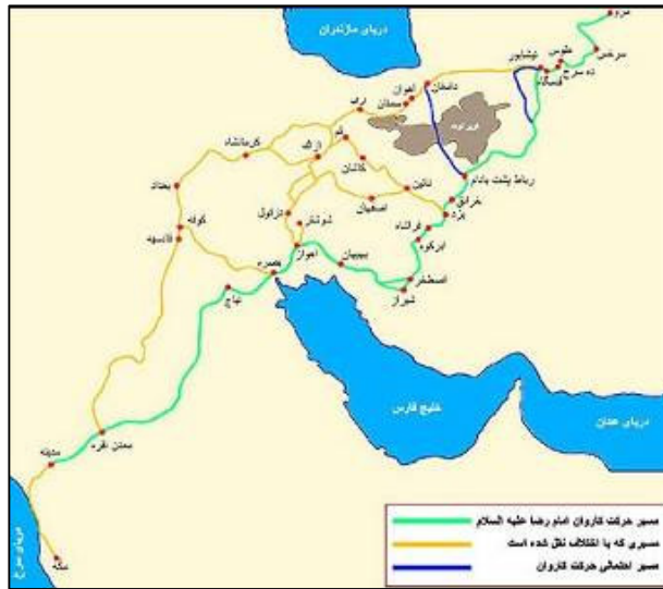
تصویر ۱. نقشه‌ای از مسیر حرکت امام رضا (ع) از مدینه تا مرو

از محل توقف و عبور امام رضا (ع) دارد ۱ که با تأکید بر عبور آن حضرت از سمت کویر یزد به سوی مرو، بر اعتبار این اماکن افزوده می‌شود. (عرفان‌منش، ۱۳۶۷: ۹۷).