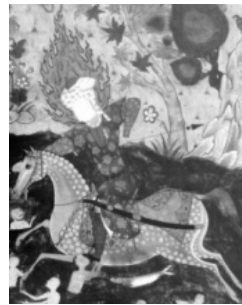
(تصویر ۲) بخشی از تصویر (۱)

درحالی‌که رنگ نارنجی متمایل به قرمز دیو خشمگین، بیان‌کننده حالت تهاجمی، رنگ زمینی و نمادی از وسوسه‌های شیطانی بوده و تقریباً تنها رنگ گرم کل این نگاره است و بایستی