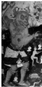
(تصویر ۳) بخشی از تصویر (۱)

اثر، حضور یکی از اولیای الهی را در حال کمک به مردم سراسیمه و پراکنده در دریا نشان می‌دهد که چهره‌اش با پوششی سفید و هاله‌ای نورانی احاطه شده و درحالی‌که نیزه را به شکم دیو بزرگ و نارنجی‌رنگ با چهره‌ای خشن فرو کرده، مشاهده می‌شود. شدت خشم این موجود دهشتناک نیز با شعله‌های منشعب از چشمان و دهانش نمایش داده شده است. بر اساس دعای توسل دیگر، احتمال دارد نجات‌دهنده افراد غریق در دریا، امام هشتم (ع) باشد. آنچه در ابتدا توجه بیننده را به خود جلب می‌کند و قابلیت تفسیر دارد، نوع گزینش رنگ‌های موجود در نگاره است که نمادی از خصوصیات درونی پیکره‌ها و نشان‌دهنده آگاهی خردمندانه نگارگر نسبت به روان‌شناسی رنگ‌هاست. بنابراین، بعضی رنگ‌ها، نماد صفات زمینی و برخی، صفات روحانی و ملکوتی را نشان می‌دهند. چنانچه لباس امام رضا (ع) با توجه به ایمان و اعتقاد ذاتی‌شان به رنگ روحانی سبز که رنگ ولایت، عصمت و طهارت و در یک کلام «صبغة الله» بوده به نمایش درآمده است. ۱ احتمال دارد دلیل انتخاب رنگ آبی اسب امام (ع) به معنی ایمان صاحب آن باشد زیرا این رنگ در هنر کهن گرا به منزله رنگ الهی و آسمانی و رحمت الهی نیز بیان شده است (آیت‌اللہی، ۱۳۷۷: ۱۶۴) (تصویر ۲).