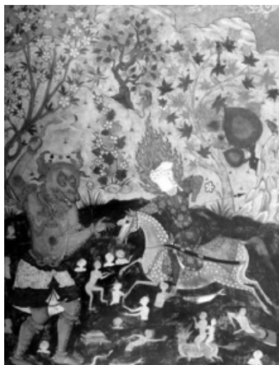
(تصویر ۱) نگاره «نجات مردم در دریا توسط امام رضا(ع)» (Farhad, 2009: 132).

نگاره «نجات مردم در دریا توسط امام رضا(ع)»، با توجه به روش آیکونولوژی به اختصار مورد خوانش قرار می‌گیرد. ۳ این تصویر یکی از بیشمارترین نگاره‌هایی است که موضوع مبارزه میان نیروهای خیر و شر را به نمایش گذاشته است. ۴ (تصویر ۱).