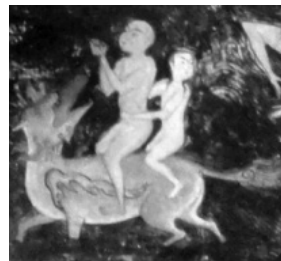
(تصویر ۵) بخشی از تصویر (۱)

اگرچه در اینجا صحنه‌ای مانند مضمون «یونس (ع) در شکم ماهی» مشاهده می‌شود که طبق آیه «وَذَا النُّونِ إِذْ ذَهَبَ...» در گرفتاری و ظلمات بایستی به پروردگار پناه برد تا از مشکلات رها شد، ولی هنرمند با تأکید بر استمداد از امام رضا (ع) در مقابله با دیو، موضوع «توسل» را به نمایش گذاشته تا بدین نکته اشاره کند که نقش توسل در دنیا غیر قابل انکار است و انسان به‌وسیله آن بایستی به خداوند نزدیک شده و حوائج مادی و معنوی خود را طلب کند (تصویر ۶).