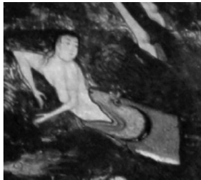
(تصویر ۶) بخشی از تصویر (۱)

احتمالاً این دیو دهشتناک را می‌توان نمایی از زندگی دنیوی نیز تصور کرد که نگارگر وی را به رنگ نارنجی و با وسایل زینتی همچون گردنبند، بازوبند، دستبند و خلخال طلایی ترسیم کرده است. این موجود خیالی با زنگوله‌ای بزرگ بر گردن و زنگوله‌های کوچک آویزان از شاخ‌هایش احتمالاً مردم را به ضلالت می‌کشاند. در بخشی دیگری از نگاره، موجودی افسانه‌ای که زن و مردی بر آن سوارند و درحالی‌که بقیه در حال فرار از دست دیو هستند آنها شادی‌کنان به سمت وی می‌روند (احتمالاً دیو که نمودی از دنیا است برخی مردم بدون دانستن خطری که از جانب وی آنها را تهدید می‌کند، با رغبت به سمت آن می‌روند) نقوش روی لباس دیو نیز از موجودات افسانه‌ای رایج در دوره صفویه تبعیت می‌کند (تصویر ۵).